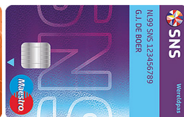
SNS Gezamenlijke Rekening