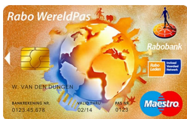
Rabo Gezamenlijke Rekening