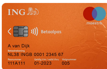
ING Gezamenlijke Rekening