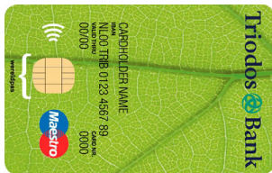
Triodos Gemeenschappelijke Rekening