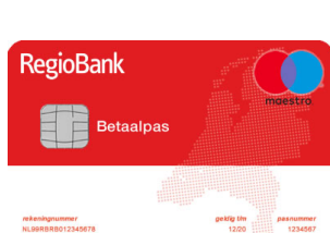
RegioBank Gezamenlijke Rekening